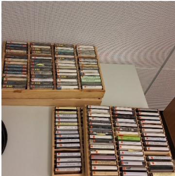
Rote Punkte auf den Kassetten und Bandhüllen geben Hinweise auf den Bearbeitungsstand.