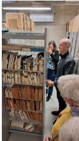
Diese alten Tonbänder müssen noch auf ihre Brauchbarkeit überprüft werden.