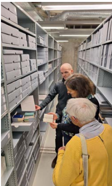
Hier werden die Originale aufbewahrt.