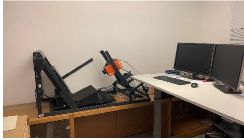
Die Multispektralkamera auf diesem Gerät dient v.a. der Dokumentation von Wasserzeichen in älteren Papieren, sichtbar gemacht werden können aber auch überklebte oder verblasste Inhalte.