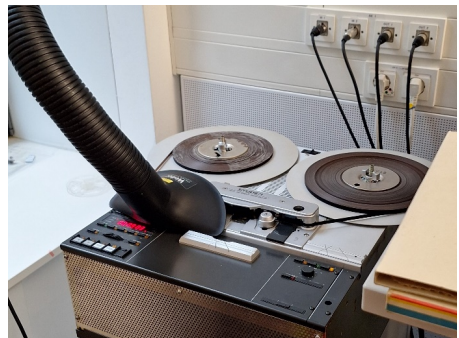
Im Tonstudio werden verschmutzte Bänder zunächst durch Absaugen gesäubert.