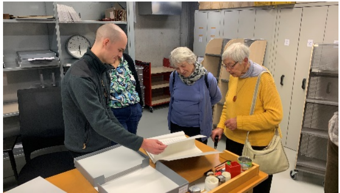
Spezialpapier umschließt zusätzlich die einzelnen Notenblätter und schützt sie vor schädlichen Umwelteinflüssen.