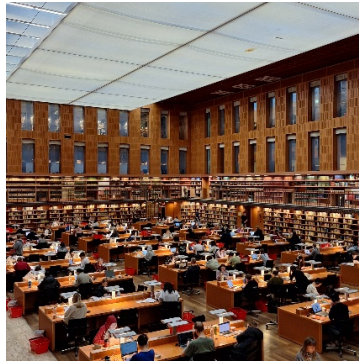
Der unterirdische Lesesaal wird durch Tageslicht von der Decke erleuchtet.

Bei einem Rundgang durch den öffentlichen Bereich der Abteilung Musik und AV-Medien staunten wir über die problemlose Ausleih- und Rückgabetechnik geliehenen Materials und die einladenden, gut abgeschirmten und technisch ausgerüsteten Einzel- wie Gruppenarbeitsplätze. In einem eigenen Raum können Podcasts produziert werden. Wir sahen auch auf den großen, vollbesetzten Lesesaal, der sich unterirdisch zwischen den beiden Hauptgebäuden befindet und von oben Tageslicht durchscheinen lässt.