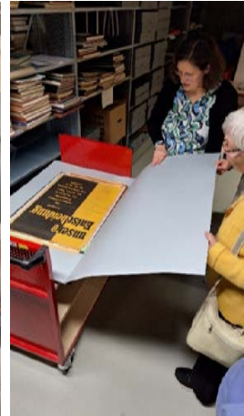
Die Eislebener Entscheidung: „1000 Jahre Eisleben“. Plakat von der UA 1960.